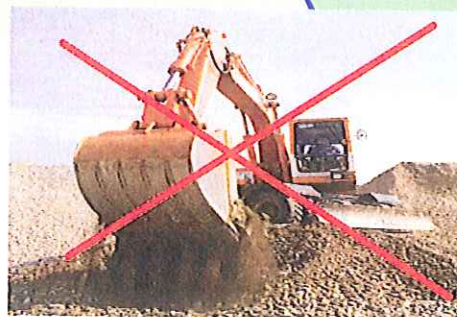
Ex.: Travaux publics

Toute activité susceptible à compromettre la sécurité du gazoduc à haute tension doit être autorisée. En particulier, il est nécessaire de clarifier au préalable, lors de travaux de minage ou d'enfoncement, si une obligation d'autorisation est nécessaire. Ceci est également valable en dehors du périmètre de 10 m.