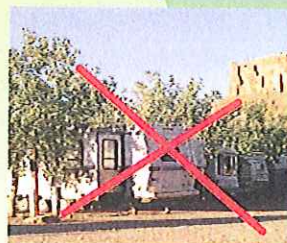
Ex.: Camping, container de chantier