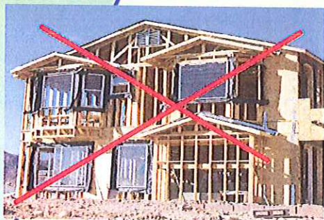
Ex.: Construction de bâtiments