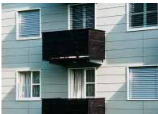
Habitation moderne: façade en plaques de fibrociment, balcons composés de planches de bois accolées difficiles à escalader.