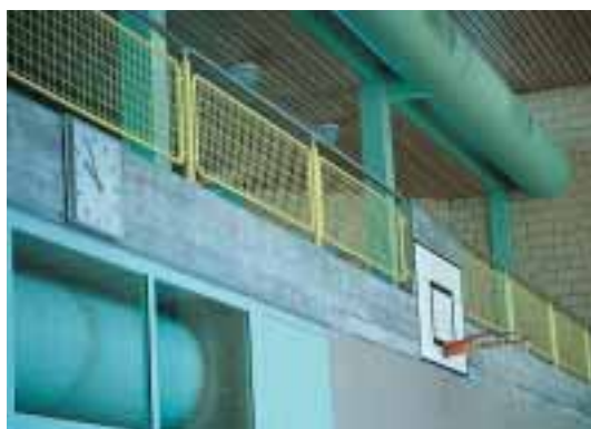
Protection contre les chutes: grillage métallique ou treillis métallique en diagonale, largeur de maille 4 cm au maximum, hauteur 1.1 m au moins.