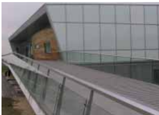
Entrée d'un bâtiment: balustrade vitrée avec main courante en acier chromé, hauteur 1.0 m.