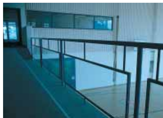
Espaces réservés au public: protections contre les chutes transparentes, vue dégagée sur les surfaces de jeux, pas d'ouverture supérieure à 12 cm de \varnothing jusqu'à une hauteur de 75 cm.