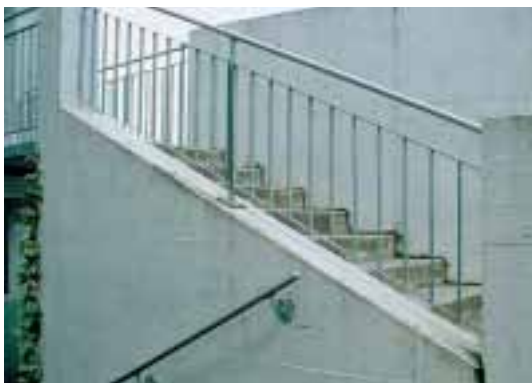
Escalier de plus de cinq marches: main courante de soutien, barreaux verticaux de protection contre les chutes.