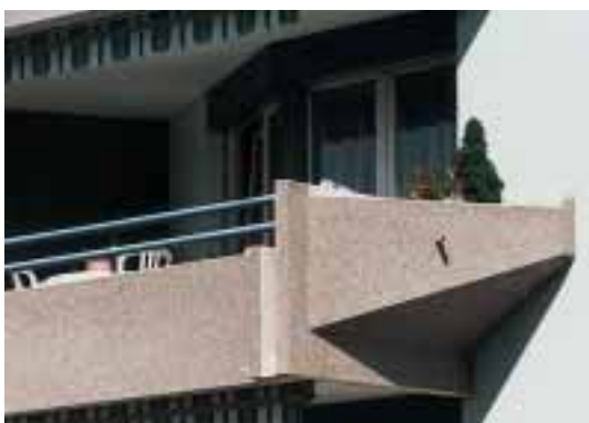
Balustrade de balcon: éléments de béton jusqu'à une hauteur de 65 cm, hauteur totale du parapet 1.0 m, jusqu'à 75 cm, pas d'ouverture supérieure à 12 cm de \varnothing , bord supérieur vers les bacs à fleurs latéraux à 1.0 m.