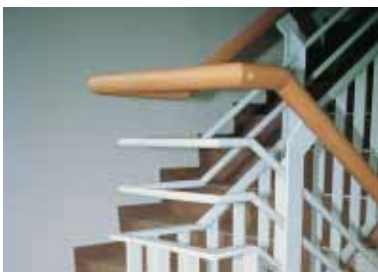
Rampe d'escalier intérieur: barreaux verticaux difficiles à escalader jusqu'à 65 cm, pas d'ouverture supérieure à 12 cm de \varnothing , hauteur totale 1.0 m, combinaison de matériaux: bois pour la main courante et métal pour la protection contre les chutes.