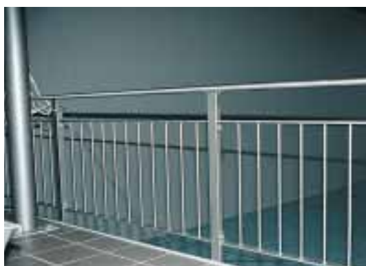
Balustrade composée de barreaux verticaux: hauteur minimale 1.1 m, difficile à escalader, transparence garantie.