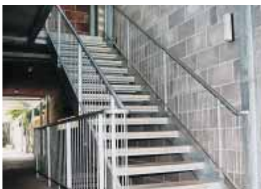
Escalier métallique ouvert: barreaux verticaux, ouvertures vers les marches d'escalier et la balustrade inférieures à 12 cm de \varnothing .