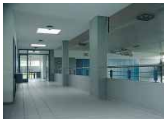
Parapet d'une galerie: hauteur totale 1.1 m, parapet de béton 65 cm au moins, pas d'ouverture supérieure à 12 cm de \varnothing jusqu'à une hauteur de 75 cm.