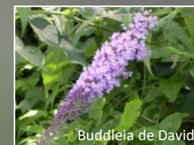
Buddleia de David