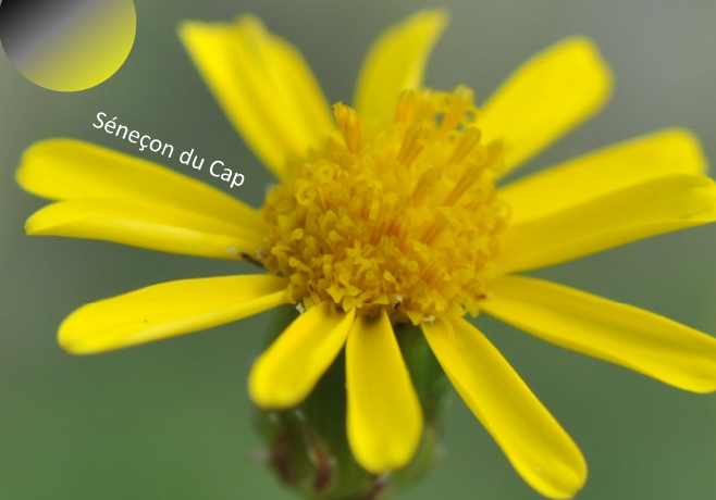
Séneçon du Cap

COMMENT LES RECONNAÎTRE ? COMMENT LUTTER ?