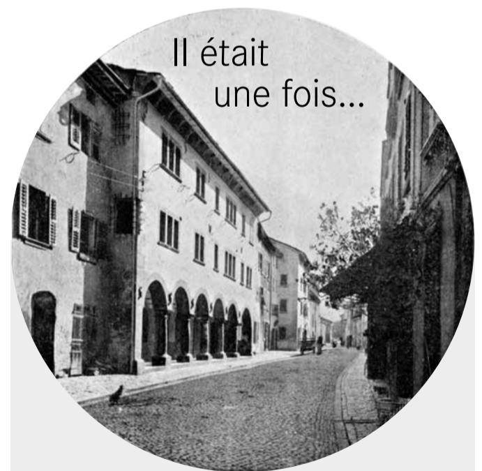
L'ancienne Maison de commune de Martigny-Bourg