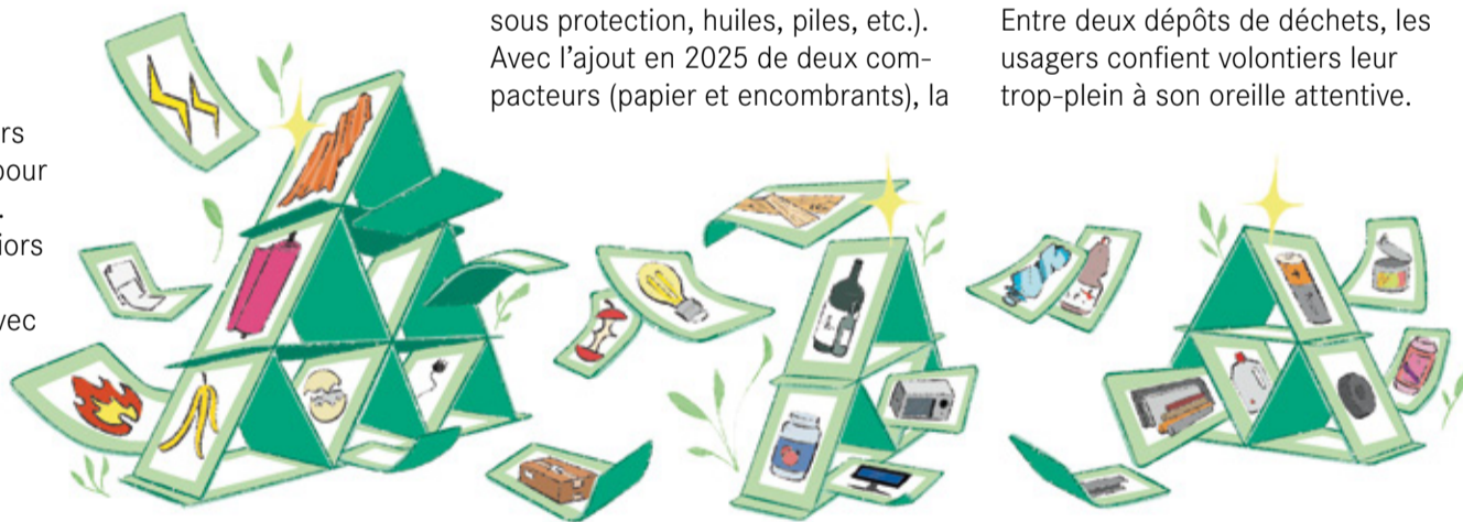
Illustration Elisa Requena