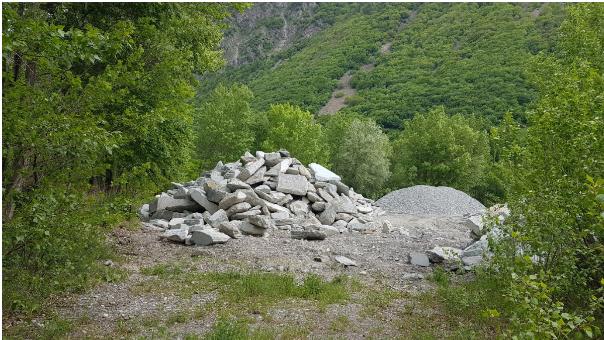
Fig. 7. Les murgiers et tas de pierres sont favorables à la petite faune, reptiles notamment.