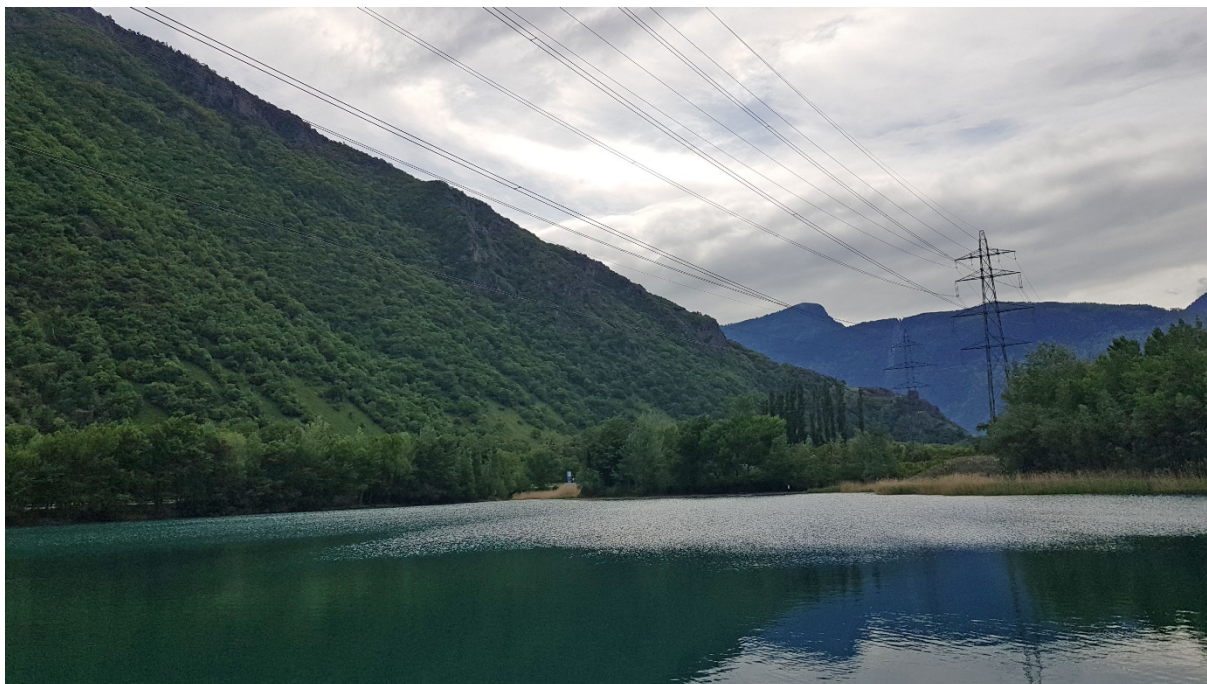
Fig. 4. Le lac des Sables (zone de protection de la nature).