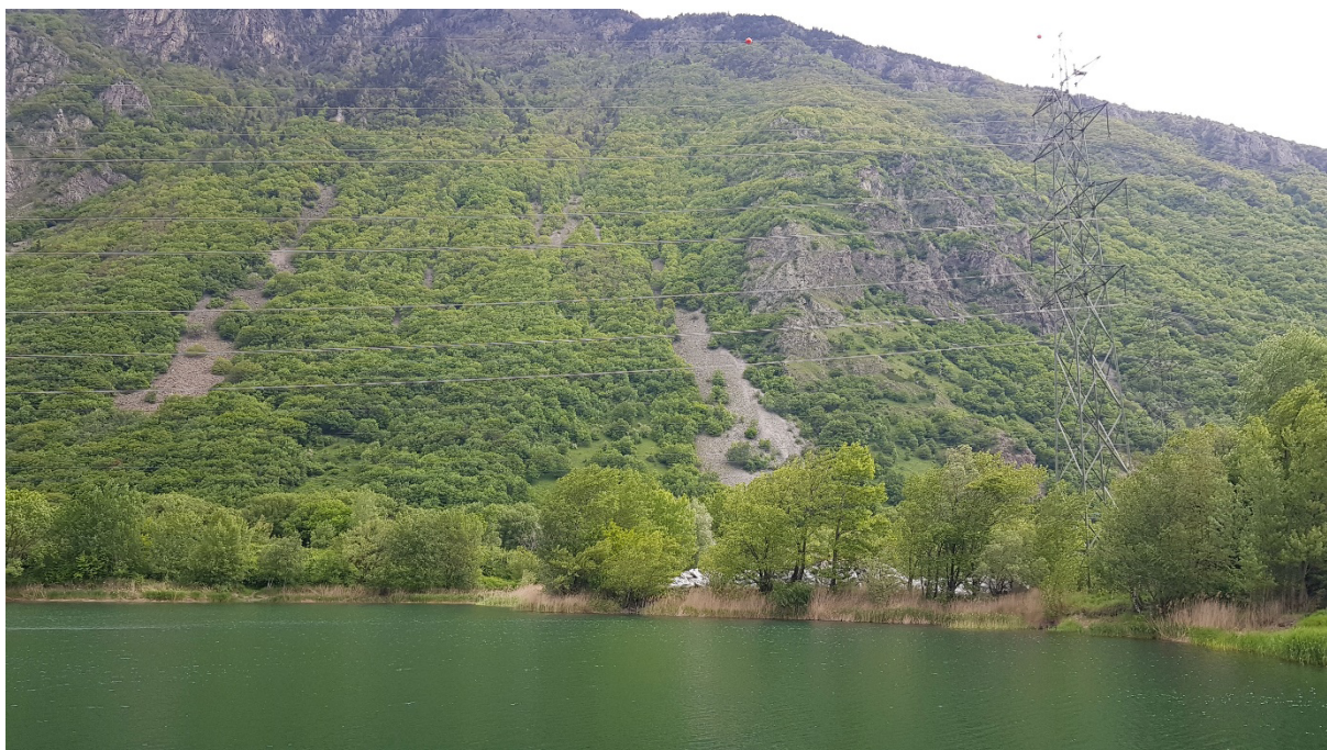
Fig. 5. Les conducteurs des lignes aériennes sont peu visibles sous certains angles et peuvent provoquer des collisions.