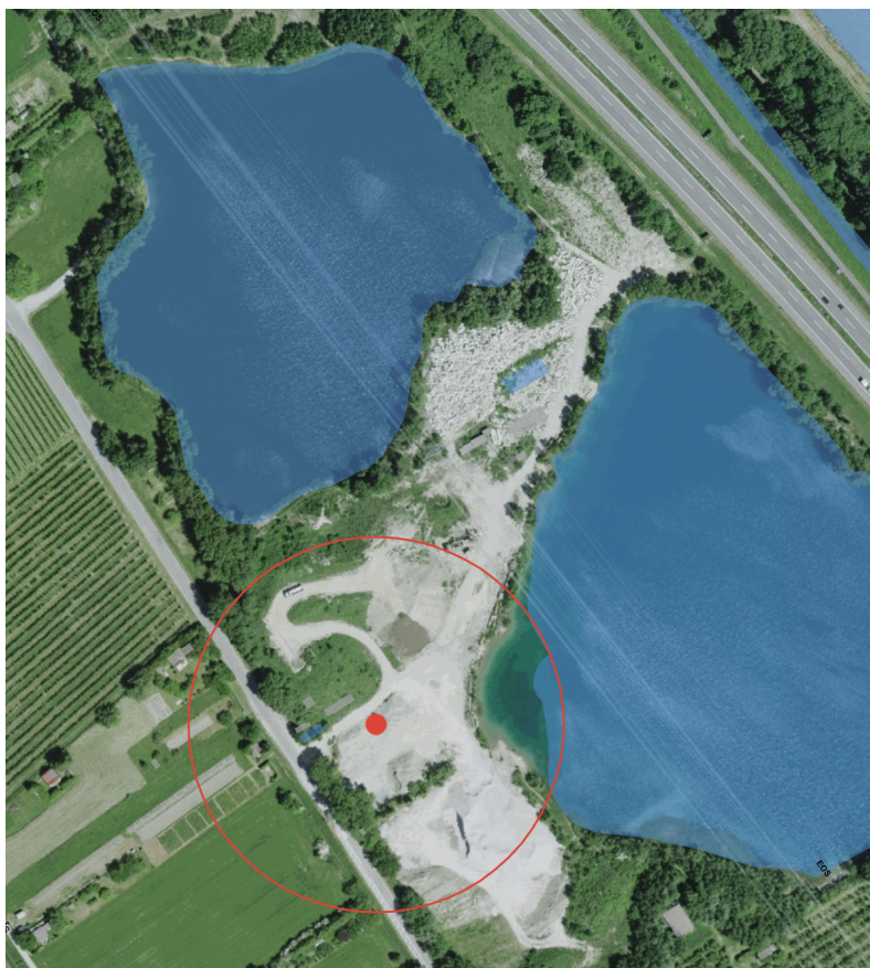
Fig. 2. Emplacement prévu pour l'éolienne E2 du parc éolien dans une zone de stockage pour des matériaux d'excavation et débris de construction. Le lac des Sables est situé au nord, et le lac Inférieure à l'est.

En effet, « le rapport d'expertise [du 10 août 2011] a été établi sur les valeurs existantes en termes d'avifaune et s'est prononcé sur la possibilité d'implantation d'un site éolien essentiellement en relation avec les couloirs de migration, mais vraisemblablement sans connaître le devenir de la gouille des Sables. Si le SCPF ne conteste pas la possibilité d'implanter un parc éolien, les impacts négatifs de la zone d'influence de l'éolienne E2 sur le périmètre de la zone nature de la gouille des Sables n'ont pas été évalués. » Il faudra donc tenir compte de « l'aspect dérangement du futur biotope situé dans cette zone de protection et du périmètre d'influence pour les oiseaux nicheurs.