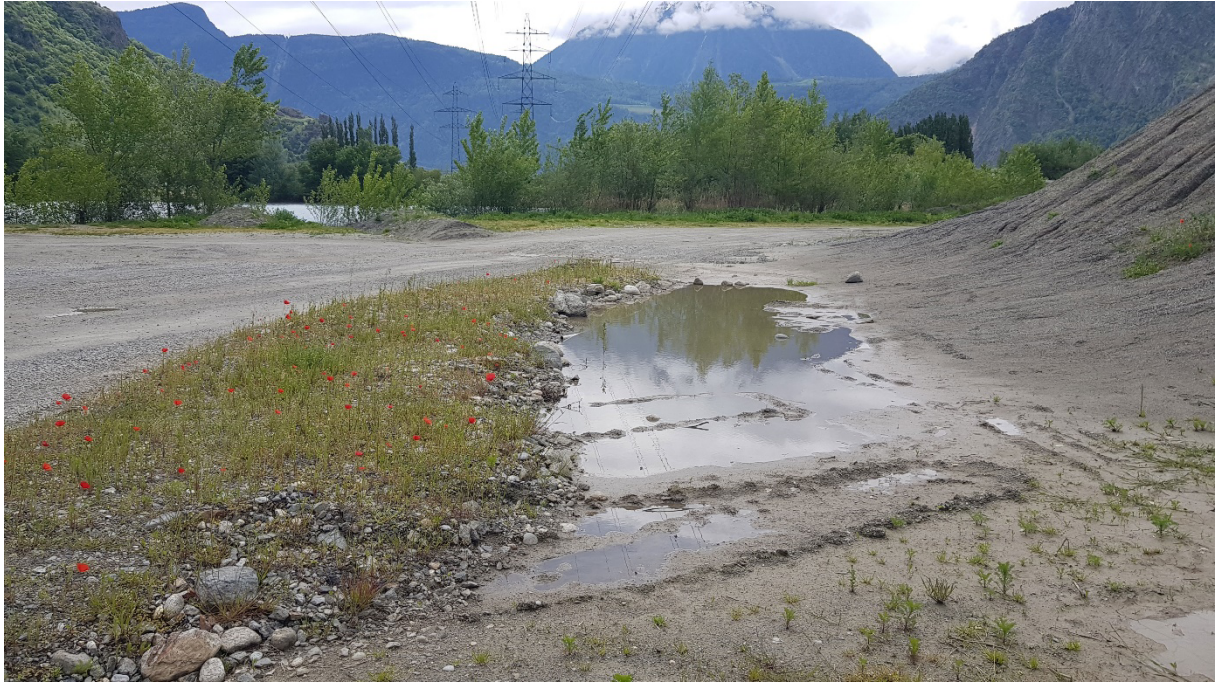
Fig. 6. Les zones pionnières de graviers sont favorables au Chevalier guignette notamment.