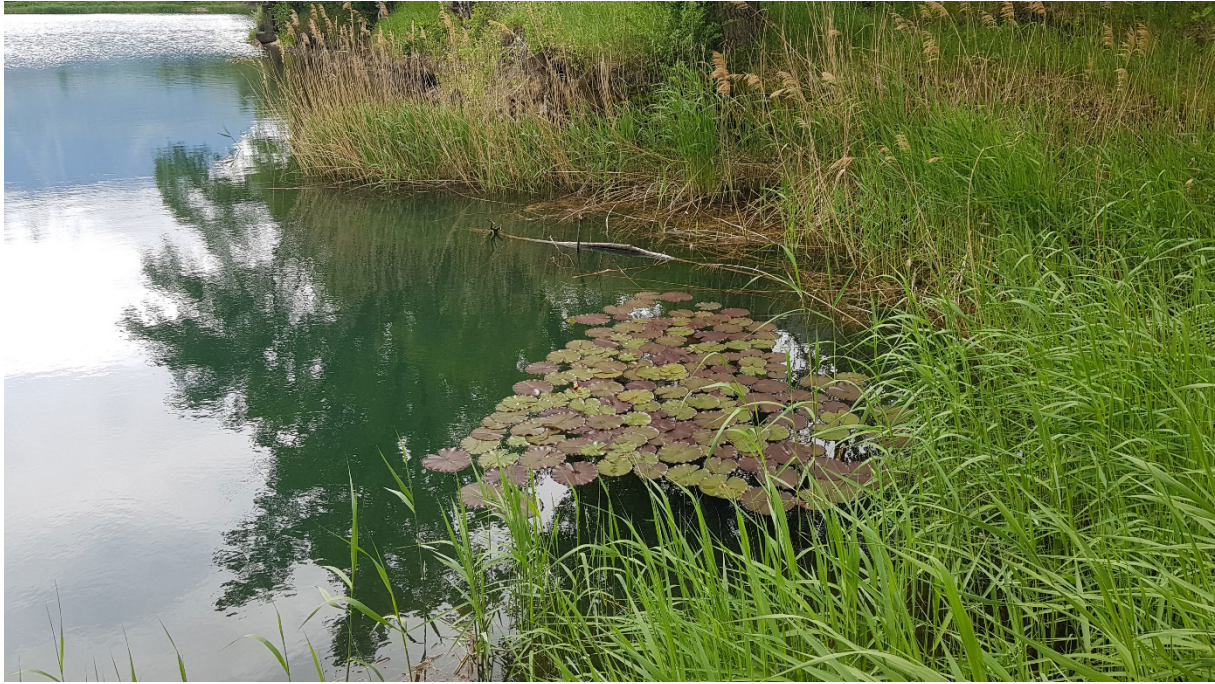
Fig. 8. La ceinture de roseaux bordant le lac des Sables est très étroite et ne convient qu'au Canard Colvert, au Grèbe huppé, à la Foulque macroule et à la Rousserolle effarvate pour la nidification.