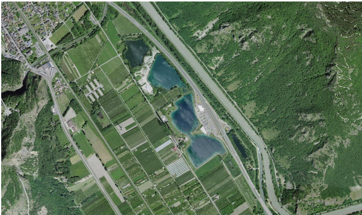
Fig. 1. Orthophoto de la zone concernée par le parc éolien Courtis Neufs. On distingue notamment l'autoroute A9, le relais du St-Bernard, les quatre lacs du Rosel, les lignes électriques à haute tension survolant les lacs, ainsi que l'éolienne-test opérationnelle depuis 2008.

En 2015, avant l'élaboration d'un plan d'affectation détaillé (PAD) pour le projet éolien Courtis Neufs et la réalisation de l'étude d'impact environnemental (EIE) correspondante, un dossier d'enquête préliminaire, assorti d'un cahier des charges conformément à l'article 8 de l'OEIE, a été présenté aux autorités cantonales. Ce dossier incluait une étude datée du 10 août 2011 sur l'impact sur l'avifaune réalisée par le biologiste-ornithologue L. Maumary. Cette expertise concluait à des effets minimes sur l'avifaune du parc éolien envisagé.